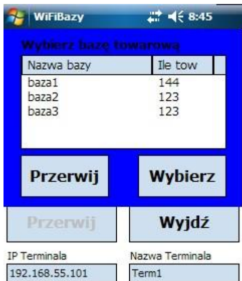
Rys. 5. Wczytywanie.