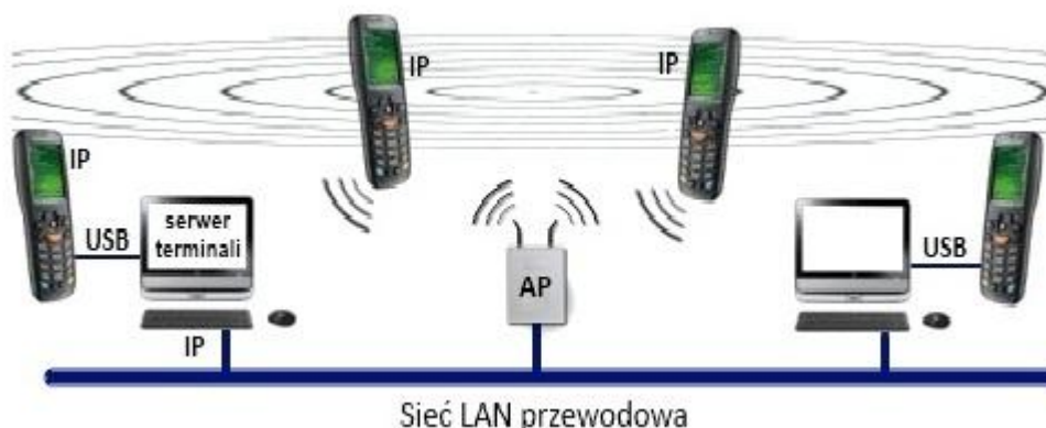
Rys.1. Transmisja między kolektorem i komputerem