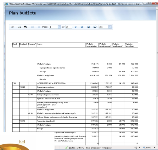
Główny widok systemu